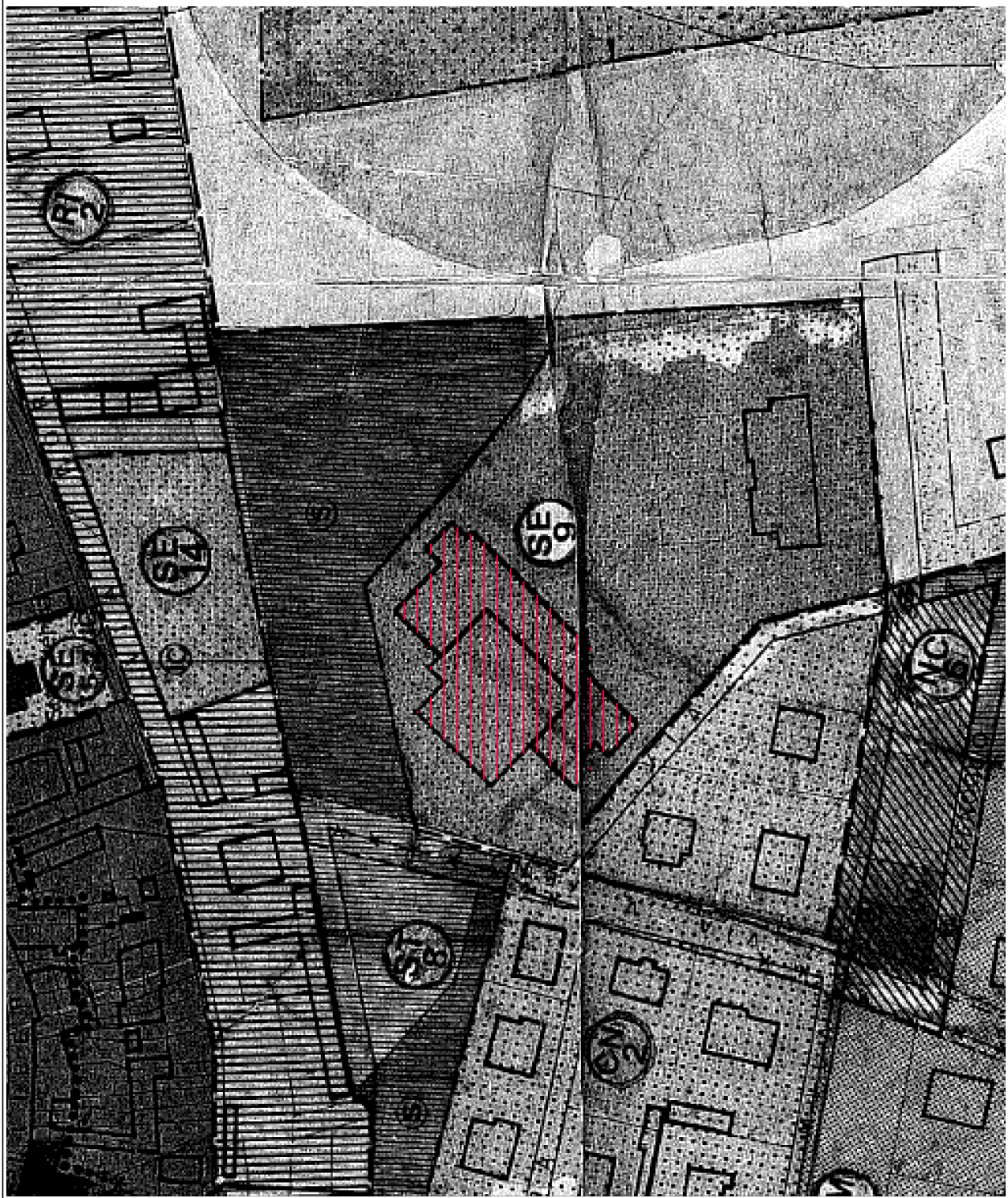
ESTRATTO P.R.G.C., scala 1:1.500